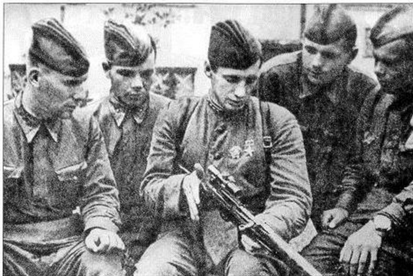
Герой Советского Союза В. Пчелинцев рассказывает бойцам о своих приемах снайперской стрельбы.