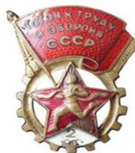
ЗНАЧКИ ГТО I СТУПЕНИ