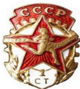
ЗНАЧОК «ОТЛИЧНИК БГТО».