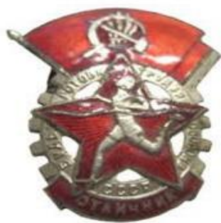
ЗНАЧОК ГТО 1 СТУПЕНИ