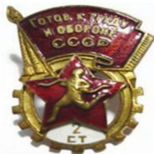
ЗНАЧОК «БУДЬ ГОТОВ К