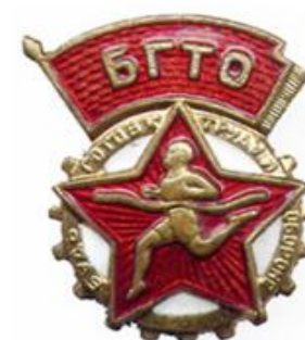
ЗНАЧКИ ГТО II СТУПЕНИ