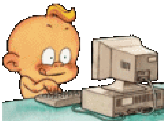
Видео- и аудиоматериалы